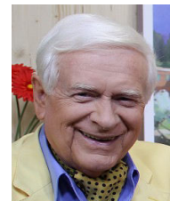
Gesundheitsexperte Hademar Bankhofer

Zum Abschluss gibt es die gemeinsame Talkrunde „Gesund & Munter auf die 100 Jahre“ bei der die anwesenden Vortragenden alle offenen Fragen beantworten.